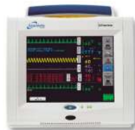
Spacelabs Healthcare Ultraview SL moduláris monitor rendszer