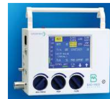
Bio-Med Devices Crossvent 3+ transzport lélegeztető