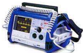
Zoll Medical M-Series defibrillátor/monitor