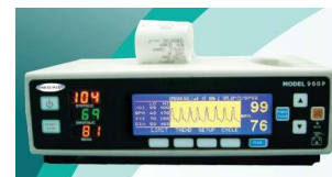
MedAir hordozható kapnográf