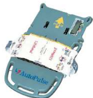
Zoll Medical AutoPulse Automatikus mellkaskompressziós készülék