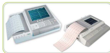
Spacelabs Healthcare delMar Voyager ekg készülékek