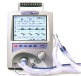
Versamed iVent201 MRI MRI kompatibilis transzport / intenzív lélegeztető