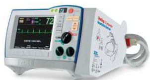
Zoll Medical R-Series defibrillátor/monitor Real CPR Help és See Thru CPR tech- nológiával