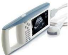
KX5100® hordozható UH diagnosztikai készülék, sürgősségi és preoperatív vizsgálatokra