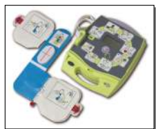
Zoll Medical AED Plus AED defibrillátor, CPR elektrodával