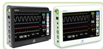
Spacelabs Healthcare élançe® kompakt monitor rendszer