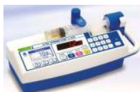
Atom Medical S1235 és P600 fecskendő és volumetrikus gyógyszer adagoló