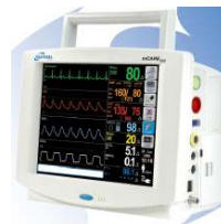
Spacelabs Healthcare mCare300 kompakt monitor