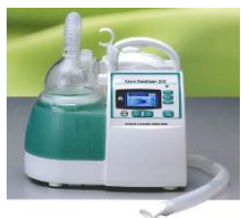
Atom Medical 303 Sanilizer UH párasító és gyógyszer- porlasztó