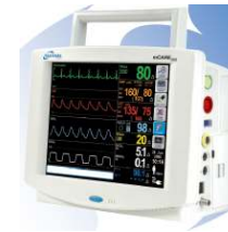
Spacelabs Healthcare Ultraview SL moduláris monitor rendszer