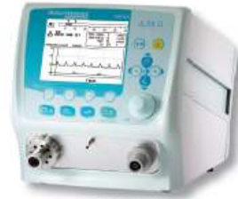
Acutronic Medical Fabian+ neo/pedi lélegeztető, IPPV/IMV, CPAP, SIPPV, SIMV, PSV, NCPAP, DuoPAP módokkal