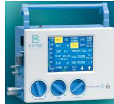
Bio-Med Devices Crossvent 2+ neo/pedi transzport lélegeztető