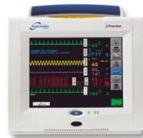
Spacelabs Healthcare mCare300 kompakt monitor