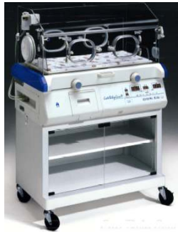
Atom Medical V-2100G klinikai és intenzív inku- bátorok