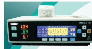
MedAir hordozható kapnográf