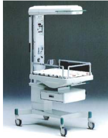
Atom Medical V-505 melegítő és újraélesztő asztal