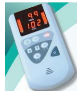
MediAid pulzusoximéter és SpO2/NIBP monitor