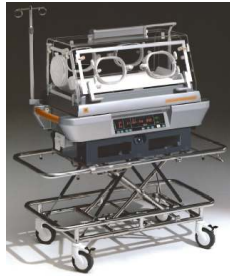
Atom Medical V-808 és V-707 transzport inkubátorok